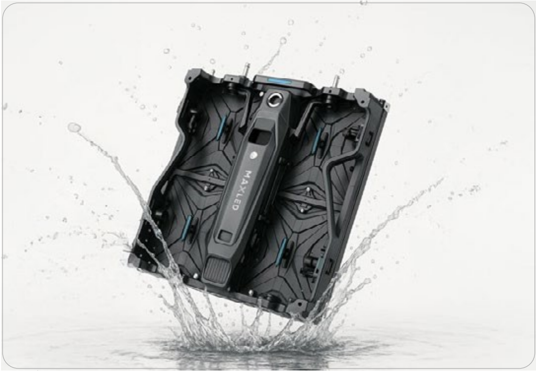
Medidas de Gabinetes: 960×960 mm

Diseño resistente al agua y polvo, con módulos de 320×160 mm que facilita instalación ágil, escalabilidad y mantenimiento eficiente en proyectos urbanos de gran escala.