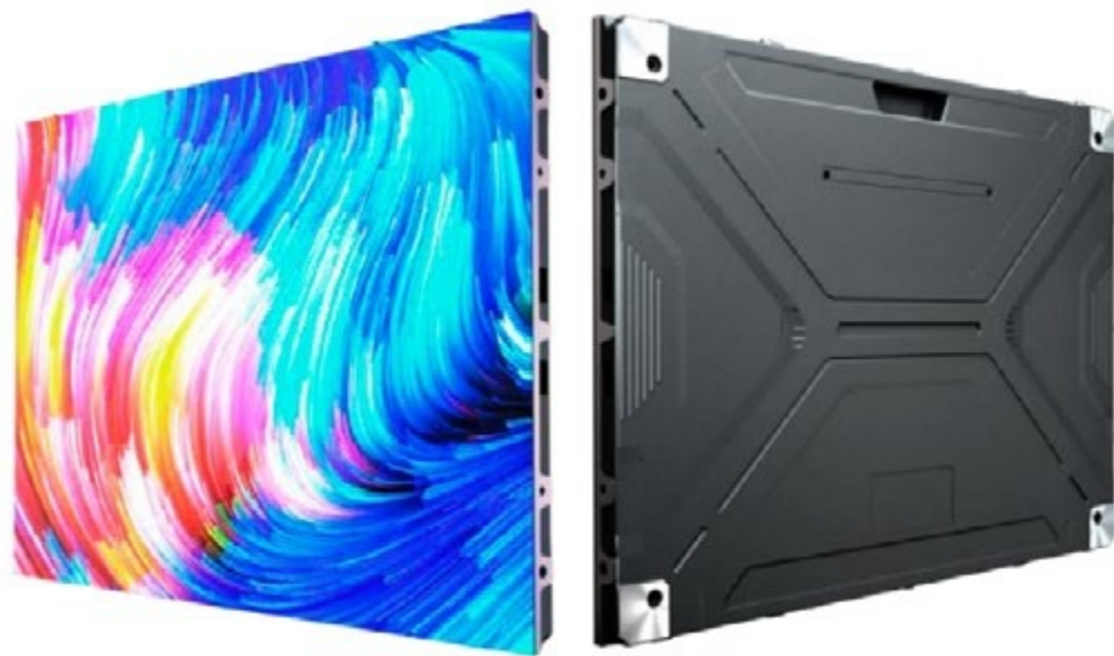
Medidas de Gabinetes: 640 x 480 mm

Con gabinetes compuestos por módulos de 320 × 160 mm, garantiza un armado preciso y escalable.